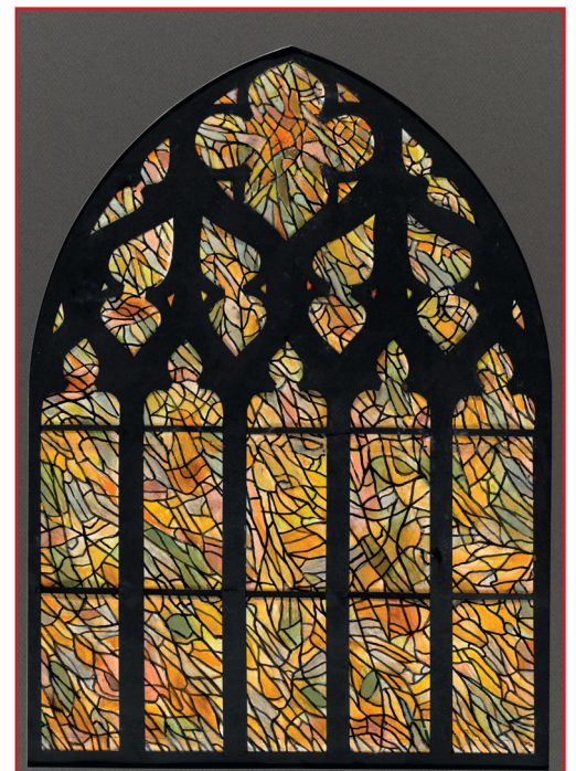
Alfred Manessier, Maquette pour un vitrail de l'église Saint-Sépulcre d'Abbeville, Les blés, ou le Pain et la Vie, 1982, huile sur carton