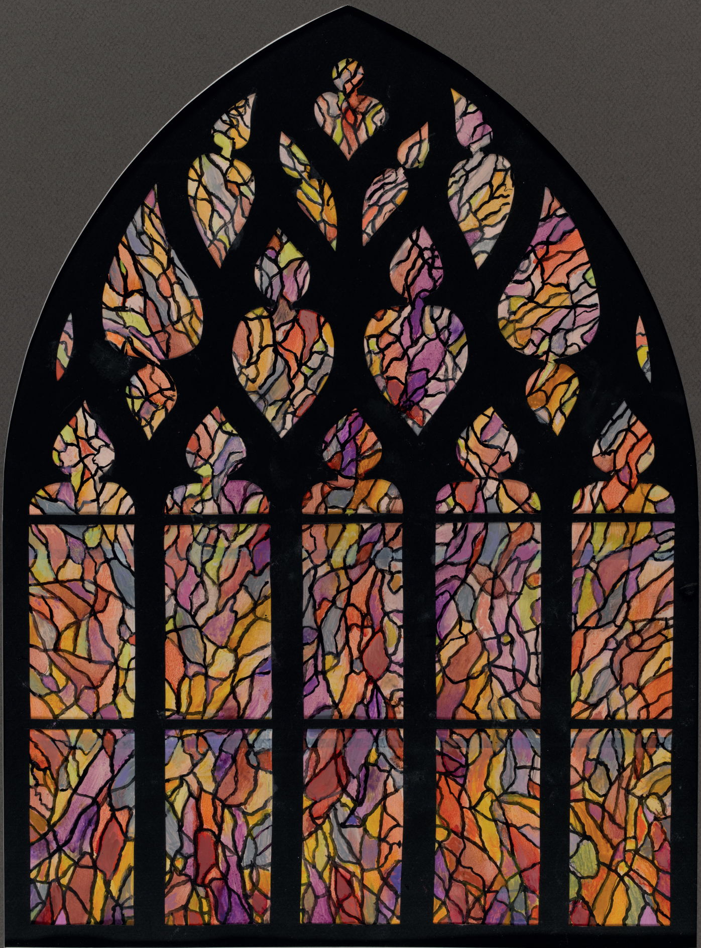
Alfred Manessier, Maquette pour un vitrail de l'église Saint-Sépulcre d'Abbeville, La Vigne véritable, le vin eucharistique , 1982, huile sur papier canson, © Le Beffroi Musée Boucher de Perthes - Manessier, Abbeville.