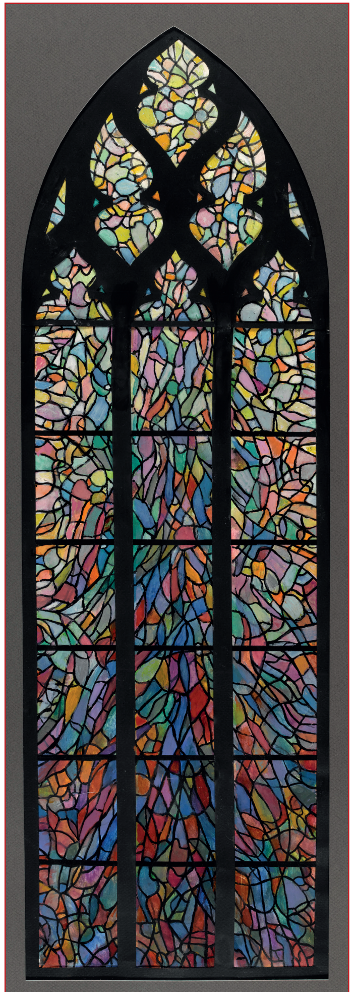
Alfred Manessier, Maquette pour un vitrail de l'église Saint-Sépulcre d'Abbeville, La joie de Pâques au petit matin ; La Résurrection , 1982, huile sur papier canson, © Le Beffroi Musée Boucher de Perthes - Manessier, Abbeville.

patrimoine.publics@abbeville.fr , ou au 03 22 20 29 69 .